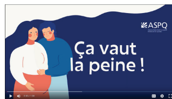
Capsule vidéo muette Soutenir