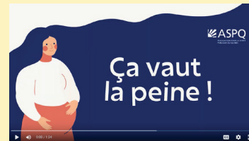
Capsule vidéo muette TSAF