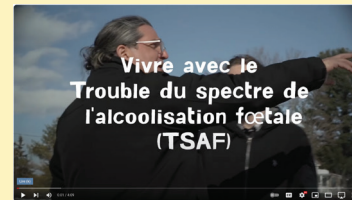
Témoignage d'un jeune adulte né avec le TSAF