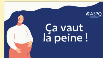
Capsule vidéo muette TSAF