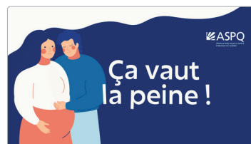
Capsule vidéo muette Soutien